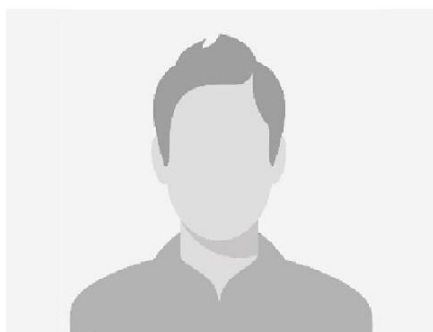
Foto de Perfil